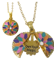
Collar Flor Mágica 27+ Productos Combinados