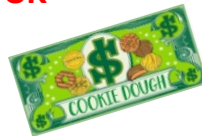
Bombilla que cambia de color 57+ Productos Combinados Q $5 OC Dolares