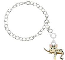
pulsera con Dije de Ocelote 37+ Productos Combinados