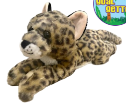
Ocelote pequeño de peluche e insignia Goal Getter 47+ Productos